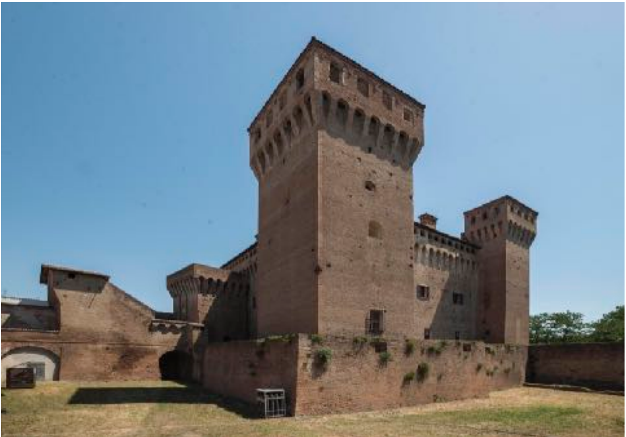
Vignola, immagini HD