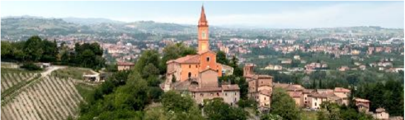
Savignano, immagini HD